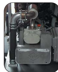
Cmax2 S, diesel-aandrijving

Cmax 2 behoort tot de laatste nieuwe generatie van olievrije schroefcompressors speciaal ontworpen voor bulktransport.