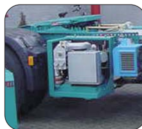
Geluidsdichte omkasting met Cmax2 S