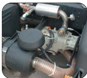
Cmax2 S met B-Box, cardanaandrijving