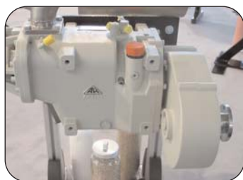
Cmax2 S met B-Box